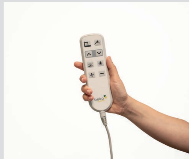
Optional: Intuitive Kabelfernbedienung mit Symbolen für alle Funktionen