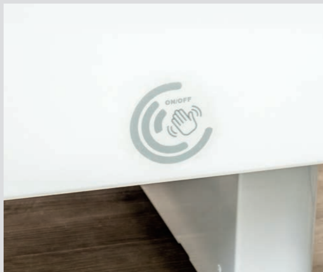
Funktionssperre aller Funktionen mittels Sensorschaltung (andere Sperrvarianten optional verfügbar)