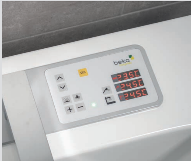
Bedienfeld mit allen Funktionen und Temperaturanzeigen für Wanneinlauf, Badewasser und Handbrause

*abhängig von bauseitiger Heißwasserversorgung