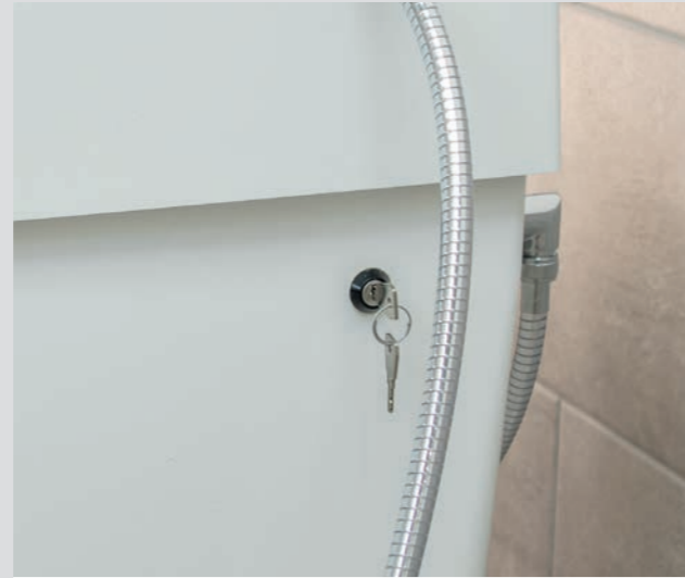
Optional: Serviceschalter zur thermischen Legionellenspülung* Deaktivierung des elektr. Verbrühschutzes durch Schließzylinder

*abhängig von bauseitiger Heißwasserversorgung