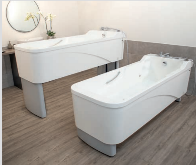
Großer Hubbereich von 400 mm mit min. Arbeitshöhe = 683 mm und max. Arbeitshöhe = 1.083 mm