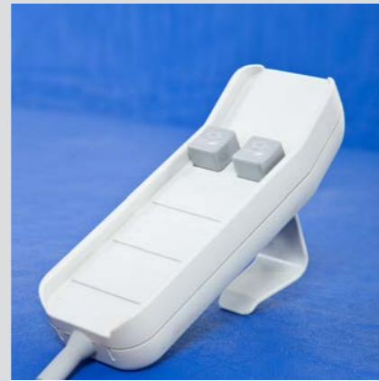
Fernbedienung zur einfachen Neigeverstellung