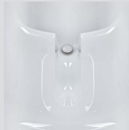
Sitzfläche mit extra großer Hygieneöffnung