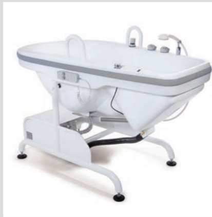
Kompakte Bauweise sorgt für geringen Platzbedarf der Wanne