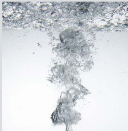
Optional: Luftperlbild mit durchblutungsfördernder Massagewirkung