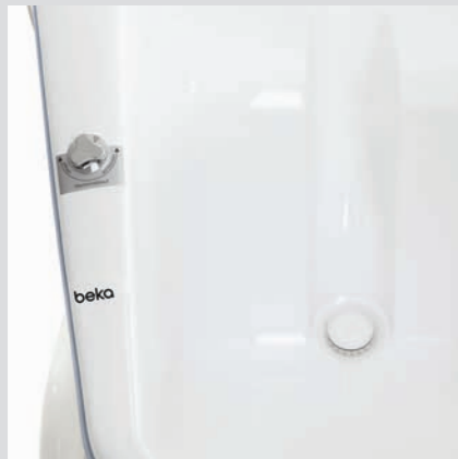
Spezieller Ablauf sorgt für überdurchschnittlich schnelle Wannentleerung