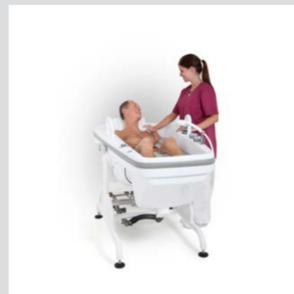
Die stufenlose, elektrische Neigefunktion bringt den Bewohner in Badeposition