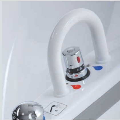
Große Haltegriffe zum sicheren Ein- und Aussteigen